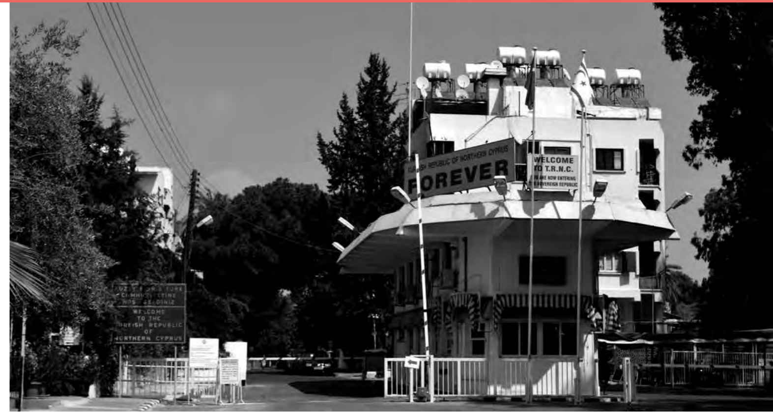
Tampon Bölgeden gelirken KKTC'nin girişi.

okul 500 TL'lik bir ücret istiyor ve annesinin ve babasının buna gücü yetmiyor. Ara sıra çıkıp gül satıyor. Her üç ayda bir, aile turist vizesini yenilemek için Türkiye'ye gidip KKTC'ye dönüş yapmak zorunda. Ailenin odağı daha çok yiyecek bulmak ve bir sonraki ayın kirasını ödemek; geleceğe dair pek planları yok.