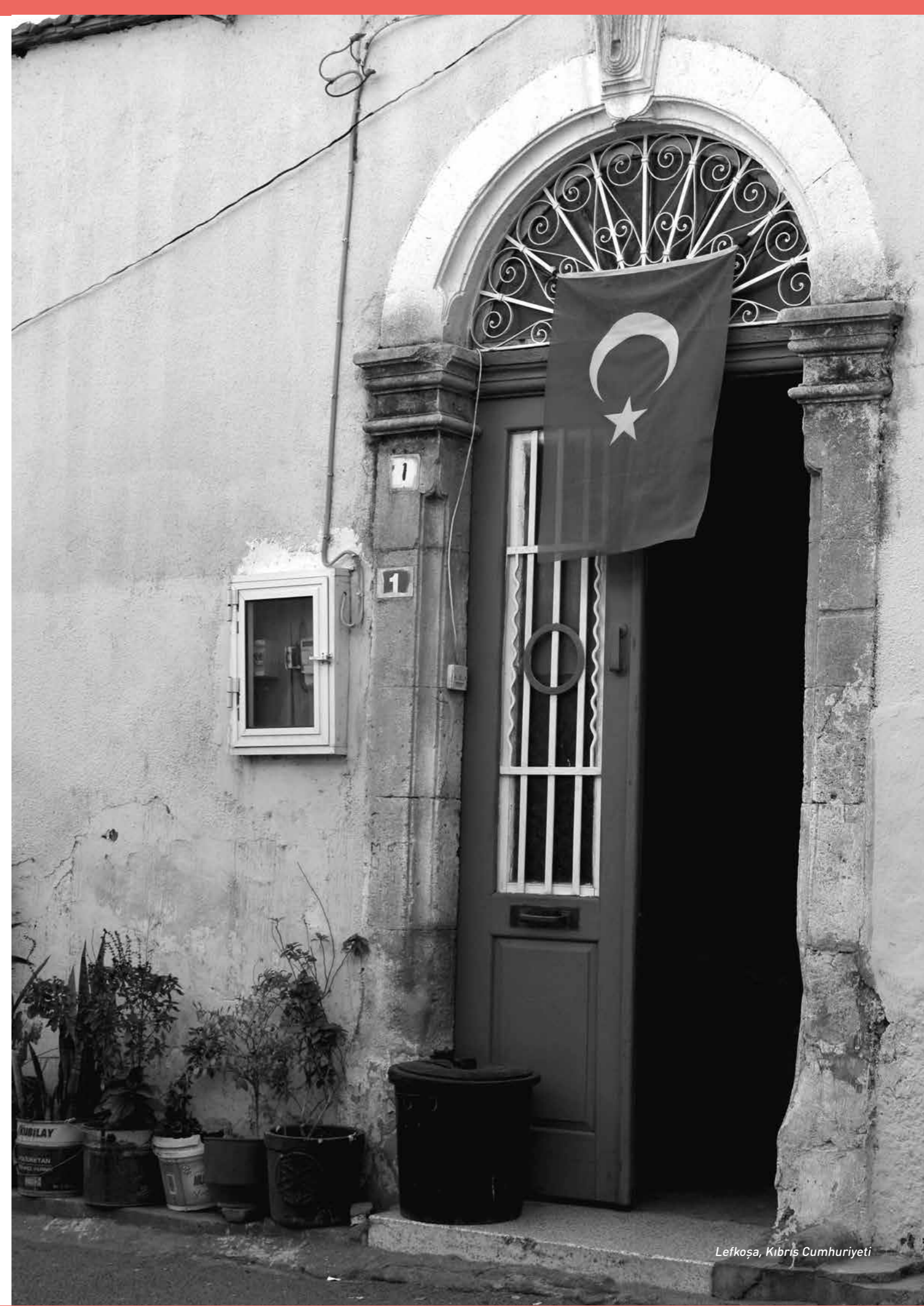
Lefkoşa, Kıbrıs Cumhuriyeti